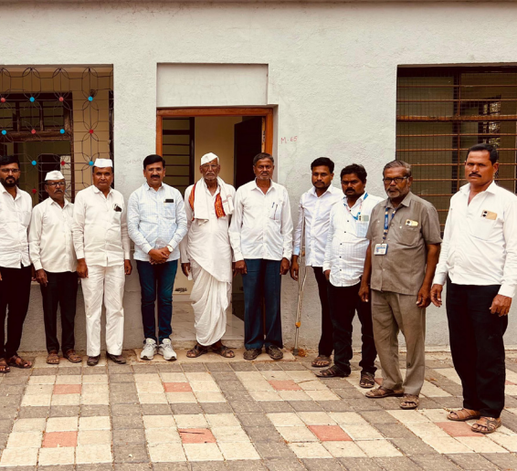
३,७०,००० (तीन लक्ष सत्तर हजार) पाटबंधारे विभाग खात्यावरील एक रकमी भरल्याने शिरूर तालुक्यासमोर एक आदर्श निर्माण केला आहे. कुकडी प्रकल्पाच्या पाण्यावर शेत करणाऱ्या अनेक भागात पाणीपट्टी भरण्याबाबत

■ जनप्रवास वार्ताहर टाकळी हाजी : मीना शाखा कालव्या अंतर्गत एकूण तीन शाखा येत असून २०२४-२०२५ शाखा निहाय वसुली पुढील प्रमाणे १) टाकळी हाजी शाखा एकूण आठ पाणी वापर संस्था पाणीपट्टी वसुली = ३,६३,२७५, २) जांबुत शाखा एकूण नऊ पाणी वापर संस्था वसुली = १,८०,००० ३) शिरोली तर्फे आठ शाखा एकूण एकूण सहा पाणी वापर संस्था वसुली = ७६,४०० मार्च अखेर पाटबंधारे विभागाकडे जमा करण्यात आली यामध्ये टाकळी हाजी शाखेतील गुरुनाथ पाणी वापर संस्था क्र. ३७. व को.पो. बंधारे वडनेर ३,५४,००० (तीन लक्ष चौपन्न हजार) व जांबुत शाखेतील संत ज्ञानेश्वर पाणी वापर संस्था क्र. ३१. व को. पो. बंधारे शरदवाडी/जांबुत