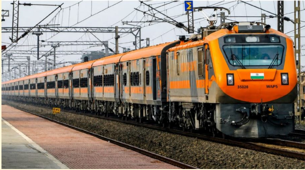
अयोध्या ते मुंबई लोकमान्य टिळक आणि श्री राम मंदिर अयोध्या यांमधे कनेक्टिव्हिटी वाढणार