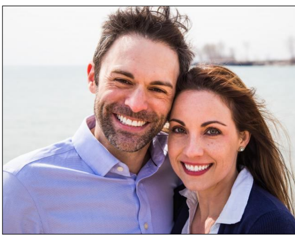
आपल्या मनात काय आहे हे स्पष्टपणे न सांगता त्या नुसत्या सवय असते, गप राहतात किंवा रडत राहतात. ही गोष्ट वारंवार होत आहे.

आपल्या मनातलं स्पष्ट बोला सगळ्याच जोडप्यांचे संबंध प्रेम, विश्वास, आत्मियता, जिवाच्याचे असतात. ते एकमेकांना समजून घेण्यासाठी उत्सुक असतात. बहुतांश मुलींना एक