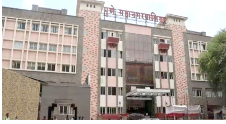
आणि अतिक्रमणांच्या गुंत्यात हा प्रकल्प खडबडला होतो.

कात्रज ते कोंढवा हा शहरातील सर्वाधिक वर्दळीचा मार्ग मानला जातो. वाढती लोकसंख्या, वेगाने वाढणाऱ्या गृहसंपुके आणि व्यावसायिक आस्थापनांमुळे या मार्गावर दिवसाच्या बहितांश वेळेत वाहतूक कोंडीची समस्या निर्माण होत असते. अनेक वर्षांपासून या रस्त्याच्या रुंदीकरणाला मागणी होत असली तरी जमीन संपादन