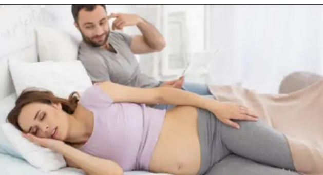
तिमाहीत ५१.२ टक्के गर्भवती महिलांना GERD चा त्रास होतो.